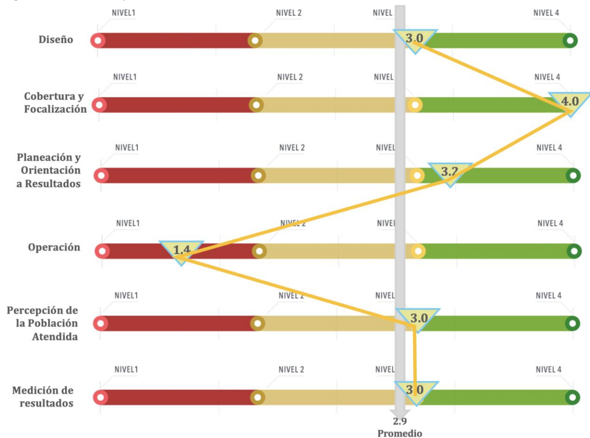
Figura 3. Valoración promedio de las temáticas evaluadas.