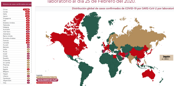
Distribución global de casos confirmados de COVID-19 por SARS-CoV-2 por laboratorio al día 25 de Febrero del 2020.