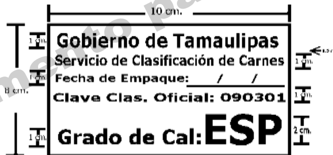
BASES PARA EL GRADO DE RENDIMIENTO

Las características y medidas del sello utilizado en cajas se representan en la siguiente figura y utilizarán las tintas correspondientes a cada grado de calidad.