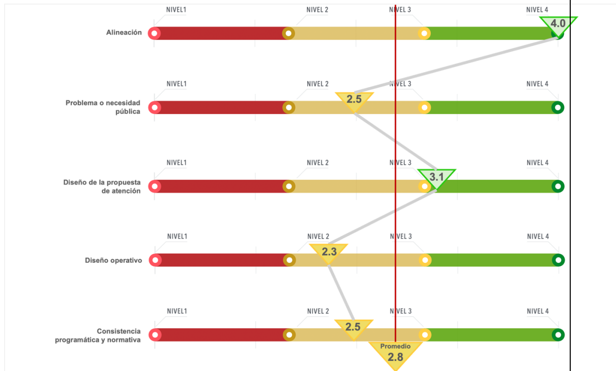
Imagen 5 Valoración del Pp S121 Comedores de Bienestar

La valoración promedio del Pp S121 fue de 2.8 en una escala de 0 a 4, donde 4 representa el nivel más alto de cumplimiento. Este resultado se vio favorecido principalmente por el apartado de características generales del programa y su alineación normativa, que alcanzó la calificación máxima de 4. Seguido, el diseño de la propuesta de atención obtuvo una valoración de 3.1, mientras que, la identificación del problema público y la consistencia programática y normativa obtuvieron una valoración de 2.5 respectivamente y su diseño operativo obtuvo una puntuación de 2.3. Evidenciando áreas de oportunidad para fortalecer los procedimientos internos, la consistencia y publicación de información, así como la incorporación de la perspectiva de género. La siguiente imagen muestra la valoración obtenida en cada sección temática: