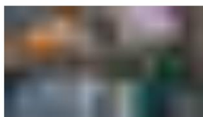
CPI 2020: Americas News • 28 January 2021